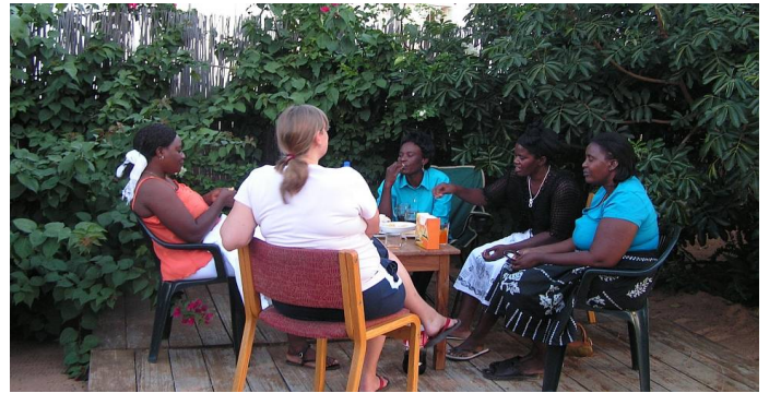
Frauenrunde bei uns im Garten

Nicht immer sei es einfach die Traditionen und die "Moderne" in Einklang zu bringen. Durch den Einfluss der Medien, vor allem des Fernsehens, würden immer mehr junge Leute ihre Traditionen in Frage stellen. Eine Entwicklung, der die vier Frauen mit gemischten Gefühlen gegenüber stehen. Einerseits "leiden" sie unter einigen Traditionen, möchten aber, dass andere nicht verschwinden. Ein Spagat, der nicht einfach zu meistern ist.