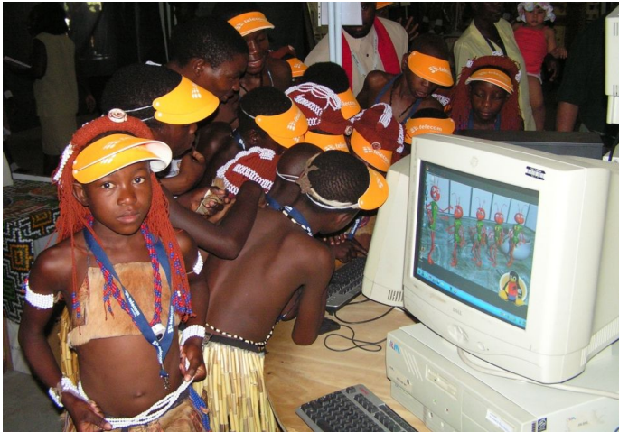
Sauyemwa Dancers nach ihrem Auftritt bei SchoolNet.