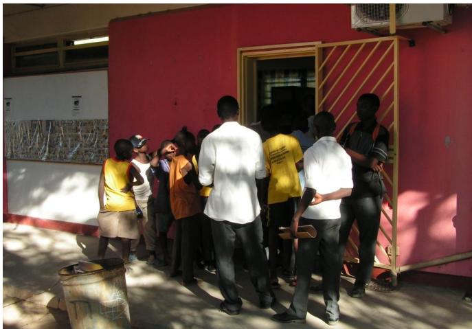
Grosses Interesse an unseren Computern

Da mein vertragliches Hauptziel mit SchoolNet, der Aufbau eines Service-Centers in Rundu, hiermit schon erfüllt war, ging es darum weitere Betätigungsfelder zu finden.