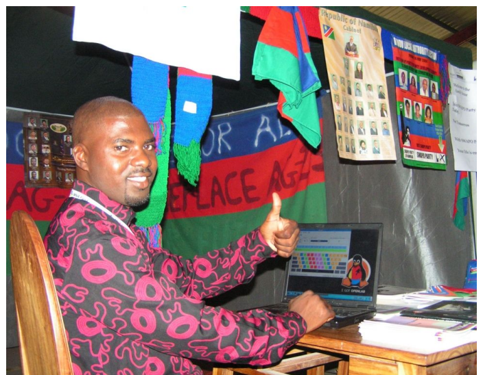
Überzeugter Linux Benutzer an der Messe (Regional SWAPO Sekretär)

Tagsüber war der Besucherandrang in den ersten beiden Tagen gering. Erst abends füllte sich die Halle. Vom dritten Tag an, waren unser 5 Computer, die wir gratis zur Verfügung stellten im Dauereinsatz, immer umlagert von wartenden Kindern. Während dem sich die Erwachsenen eher für unsere Laptop (Marke: LG für 1000CHF) und Desktop Aktionen (700CHF) interessierten.