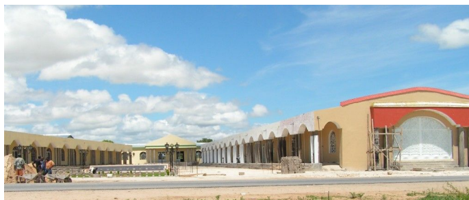
Der neuste Einkaufstempel im Bau

Der Froschprinz: Gar Unheimliches erzählt man sich über eine Geburt im Rundu State Hospital. Laut Aussagen der Lehrerkolleginnen hat dort eine Frau anstelle eines Kindes einen Frosch zur Welt gebracht. Die Frau sei mit dem Nachbarn fremd gegangen und habe so ihre Strafe erhalten. Wer weiss, vielleicht muss der Frosch nur geküsst werden!