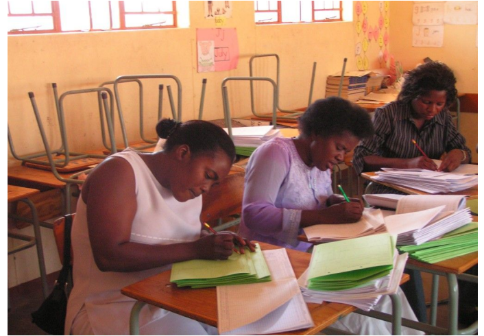
Rauchende Köpfe beim Ausfüllen der Formulare

min der Unterlagen erst Ende Oktober war, wartete die Kavango-Region bis zur letzten Minute.