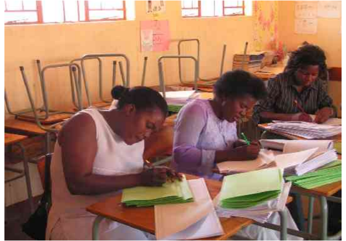
Rauchende Köpfe beim Ausfüllen der Formulare

min der Unterlagen erst Ende Oktober war, wartete die Kavango-Region bis zur letzten Minute.