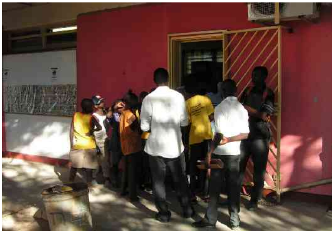
Grosses Interesse an unseren Computern

Da mein vertragliches Hauptziel mit SchoolNet, der Aufbau eines Service-Centers in Rundu, hiermit schon erfüllt war, ging es darum weitere Betätigungsfelder zu finden.