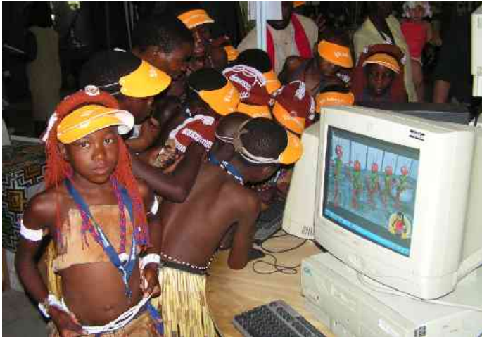
Sauyemwa Dancers nach ihrem Auftritt bei SchoolNet.