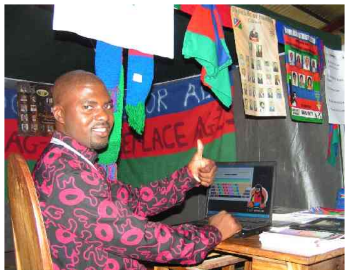
Überzeugter Linux Benutzer an der Messe (Regional SWAPO Sekretär)

Tagsüber war der Besucherandrang in den ersten beiden Tagen gering. Erst abends füllte sich die Halle. Vom dritten Tag an, waren unser 5 Computer, die wir gratis zur Verfügung stellten im Dauereinsatz, immer umlagert von wartenden Kindern. Während dem sich die Erwachsenen eher für unsere Laptop (Marke: LG für 1000CHF) und Desktop Aktionen (700CHF) interessierten.