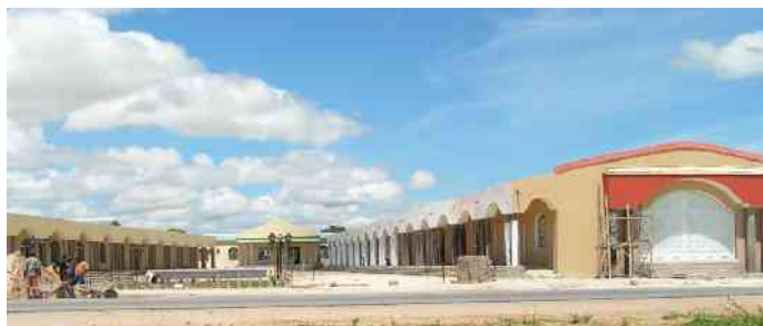
Der neuste Einkaufstempel im Bau

Der Froschprinz: Gar Unheimliches erzählt man sich über eine Geburt im Rundu State Hospital. Laut Aussagen der Lehrerkolleginnen hat dort eine Frau anstelle eines Kindes einen Frosch zur Welt gebracht. Die Frau sei mit dem Nachbarn fremd gegangen und habe so ihre Strafe erhalten. Wer weiss, vielleicht muss der Frosch nur geküsst werden!