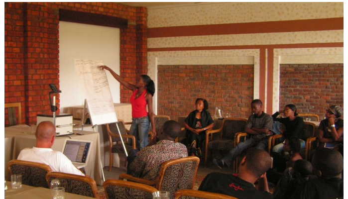
Windhoek, Januar 2006 - strategisches SchoolNet Treffen, Gruppenarbeiten werden vorgestellt.

wir die Informationen um einiges schneller und die Zusammenarbeit klappt einiges besser.