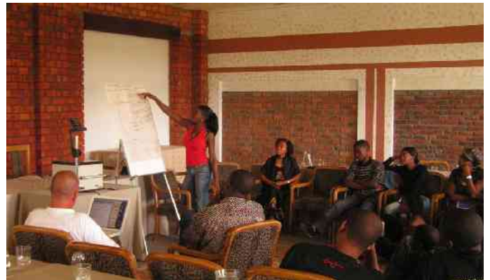
Windhoek, Januar 2006 - strategisches SchoolNet Treffen, Gruppenarbeiten werden vorgestellt.

wir die Informationen um einiges schneller und die Zusammenarbeit klappt einiges besser.