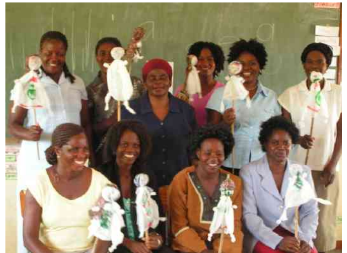
Workshop Teilnehmer -Gebastelte Puppen als Helfer, Erzähler und Spassmacher

Die Mehrzahl der neuen Erstklässler, wurden an ihrem ersten Schultag von einem Elternteil oder Verwandten begleitet. Staunend und noch etwas verschlafen konnte