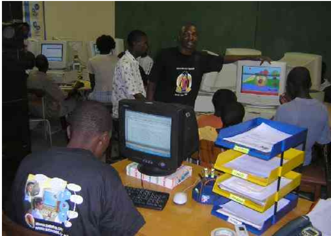
Temporäres Computer lab ist eröffnet, grosses Interesse

noch vom Namibian College of Open Learning (NamCol) als Lager verwendet. Es wird wohl noch einige Zeit dauern, bis sich die Direktorin von NamCol und der Erziehungsdirektor auf den Verwendungszweck des Raumes einigen können.